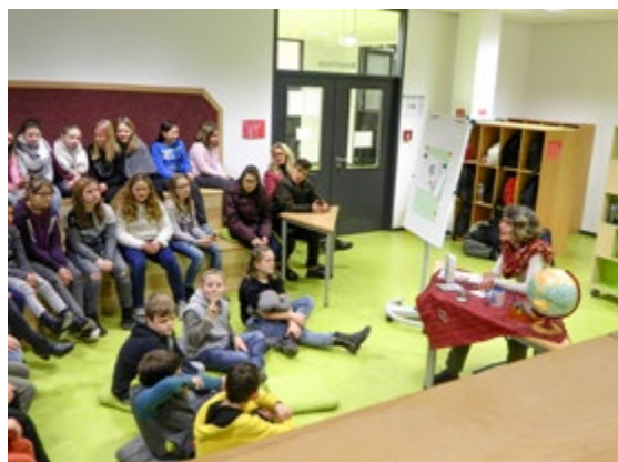
Autorenlesung in der Schulbibliothek