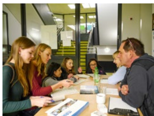
Alsbacher-Info-Börse-für-Ausbildung - AIBA